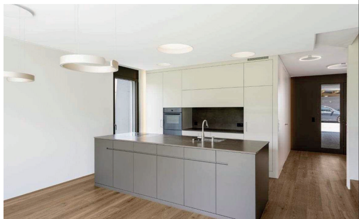
Eine der vielen hochwertigen Küchen aus der Schreinerei Staffelbach